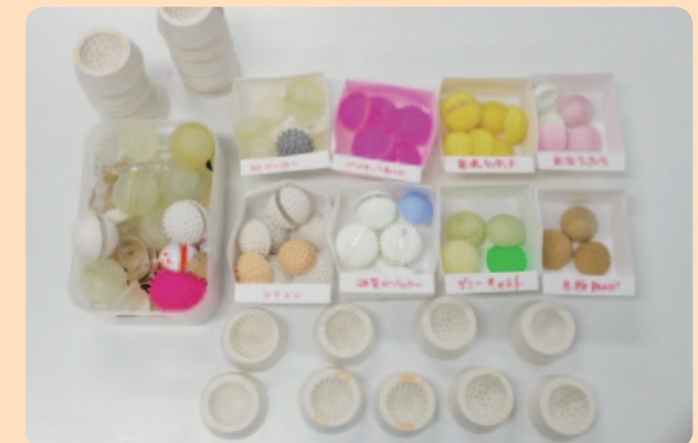
形、素材、大きさなどの試作